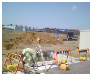
4/14 基礎工事が始まりました