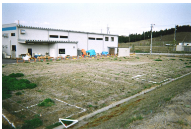
既存工場南側の建設地