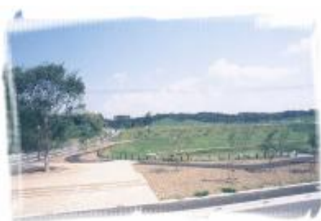
甲南フロンティアパーク

また、開発・研究型の企業を目指し、フライス・旋盤・ボール盤等の金属加工設備を備えたワークショップを設置し、お客様が必要とする品質・機能やアイデアの実現をサポートしたいと考えています。